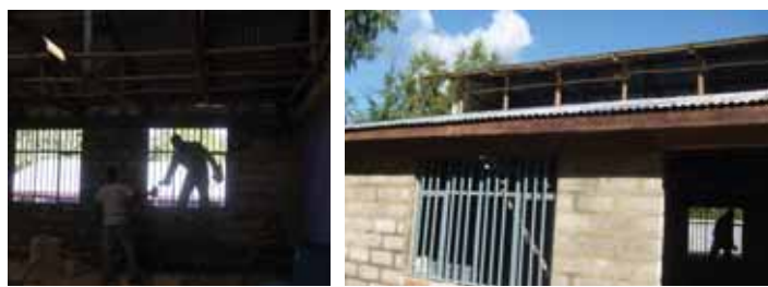
Κατασκευή κουζίνας στο Mihur