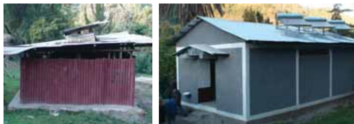
Τουαλέτες και οι ντουσιέρες στη Woldia πριν και μετά

Τα έσοδα από τις εκδηλώσεις που διοργανώνουμε κάθε χρόνο μετατρέπονται σε έργα. Με τα έσοδα από την χοροεσπερίδα του 2007 έγιναν στο Κέντρο της Woldia οκτώ τουαλέτες, έξι ντουσιέρες και τοποθετήθηκαν τρεις ηλιακοί θερμοσίφωνες, ώστε τα παιδιά να πλένονται επιτέλους με ζεστό νερό. Με τα έσοδα εκείνης του 2008 κατασκευάζονται η κουζίνα και οι τουαλέτες του Mihur. Με τα έσοδα της φετινής χοροεσπερίδας προγραμματίζεται έργο υδροδότησης ή/και καθαρισμού νερού στο Κέντρο της Asela. Έργο αναγκαίο, για να σταματήσουν τα παιδιά του Κέντρου αυτού να αρρωσταίνουν από μολύνσεις και δερματοπάθειες που οφείλονται στο νερό, είναι η παροχή καθαρού νερού. Αναλυτικά στοιχεία για τα έργα θα δοθούν στη Γενική Συνέλευση της 24ης Μαΐου.