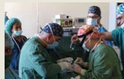
Ιδιαίτερες ευχαριστίες στην Ελληνική Οργάνωση «Αποστολή Άνθρωπος»